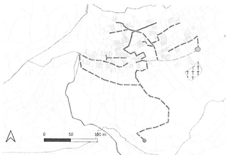
Figure 8 - proposition de tracé 2 de réseau séparatif et emplacement de la future STEP au sud du Bourg de l'Illier