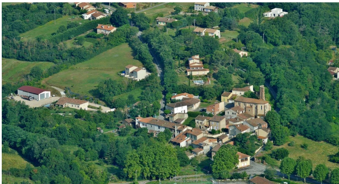
Schéma Directeur d'Assainissement des Eaux Usées